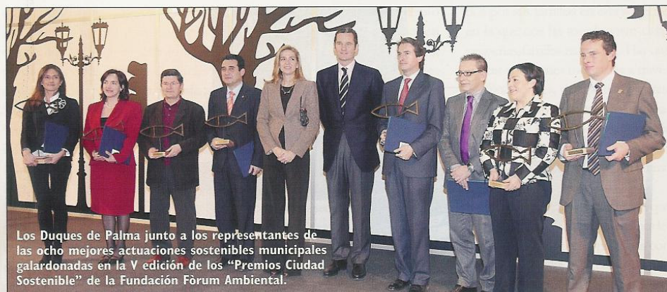
Los Duques de Palma junto a los representantes de las ocho mejores actuaciones sostenibles municipales galardonadas en la V edición de los "Premios Ciudad Sostenible" de la Fundación Fòrum Ambiental.